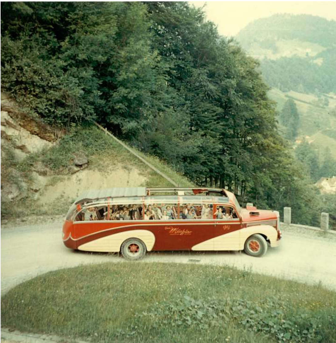
<<1947 Saurer 4CT1D mit Wechsel-Carosserie 'Seitz' Kreuzlingen, 30 Plätze mit Ausflugs-Carosserie>>