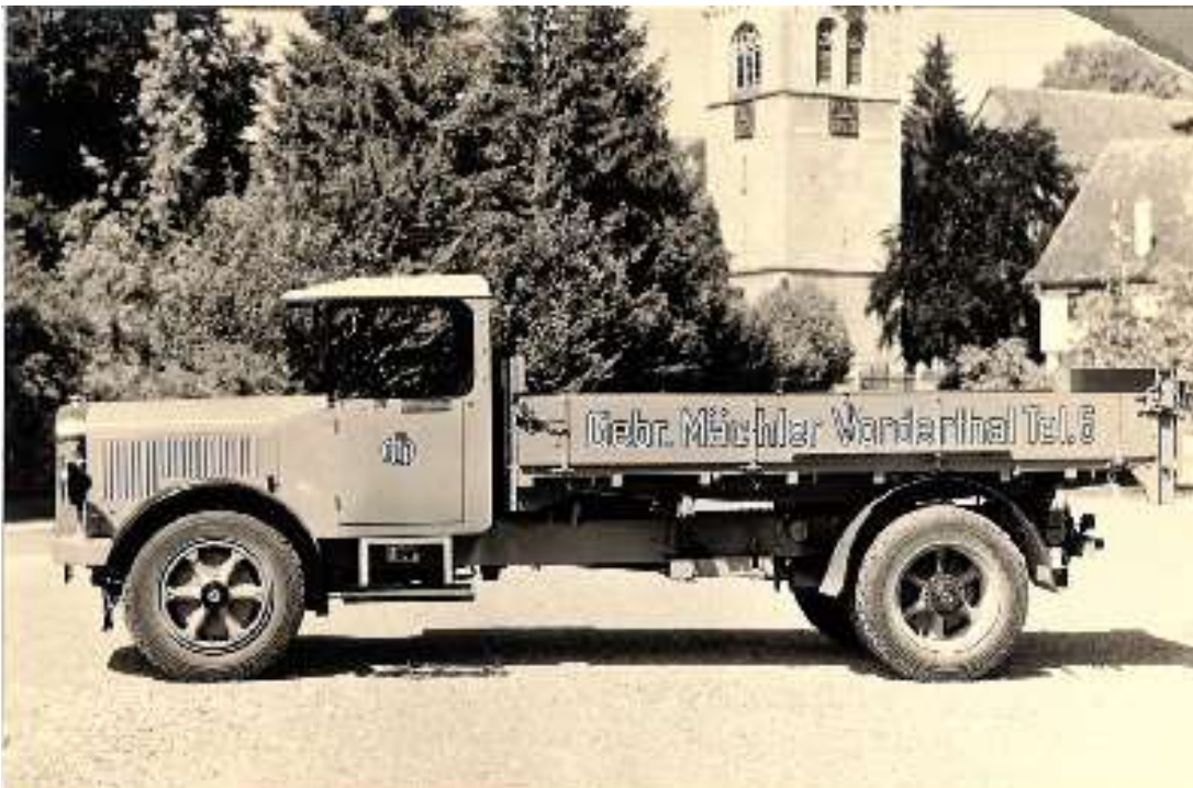
<<Lastwagen Saurer BLD mit Kippbrücke – Abholung bei Saurer am Ufer des Bodensee in Arbon>>

1931 Tod des Firmengründers Melchior Mächler, «Fuermä-Melk»