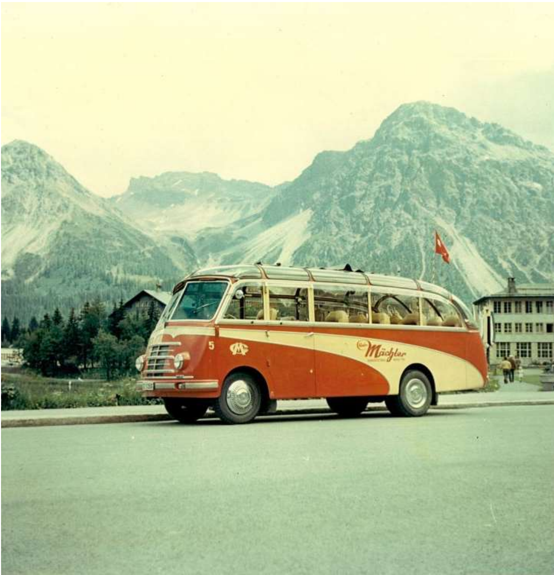
<<1954 Kleincar Chevrolet mit Carrosserie 'Tüscher' Zürich, 15 oder 18 Plätze, in Arosa beim Obersee>>