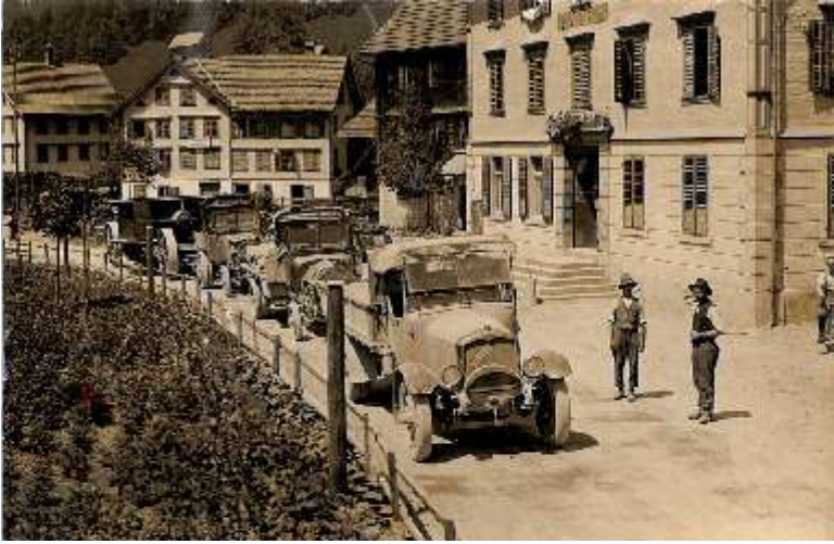
<<Marschhalt im Dorf Vorderthal, Mächler-Lastwagen Saurer AE (zu vorderst) im Einsatz für den Kraftwerk-Neubau; hier wird eine Drossel-Klappe im Transport-Konvoi mit 3 zusammengehängten Lastwagen (alle beladen mit Ballast) für das neue Kraftwerk-Wägital transportiert (ca. 1923)