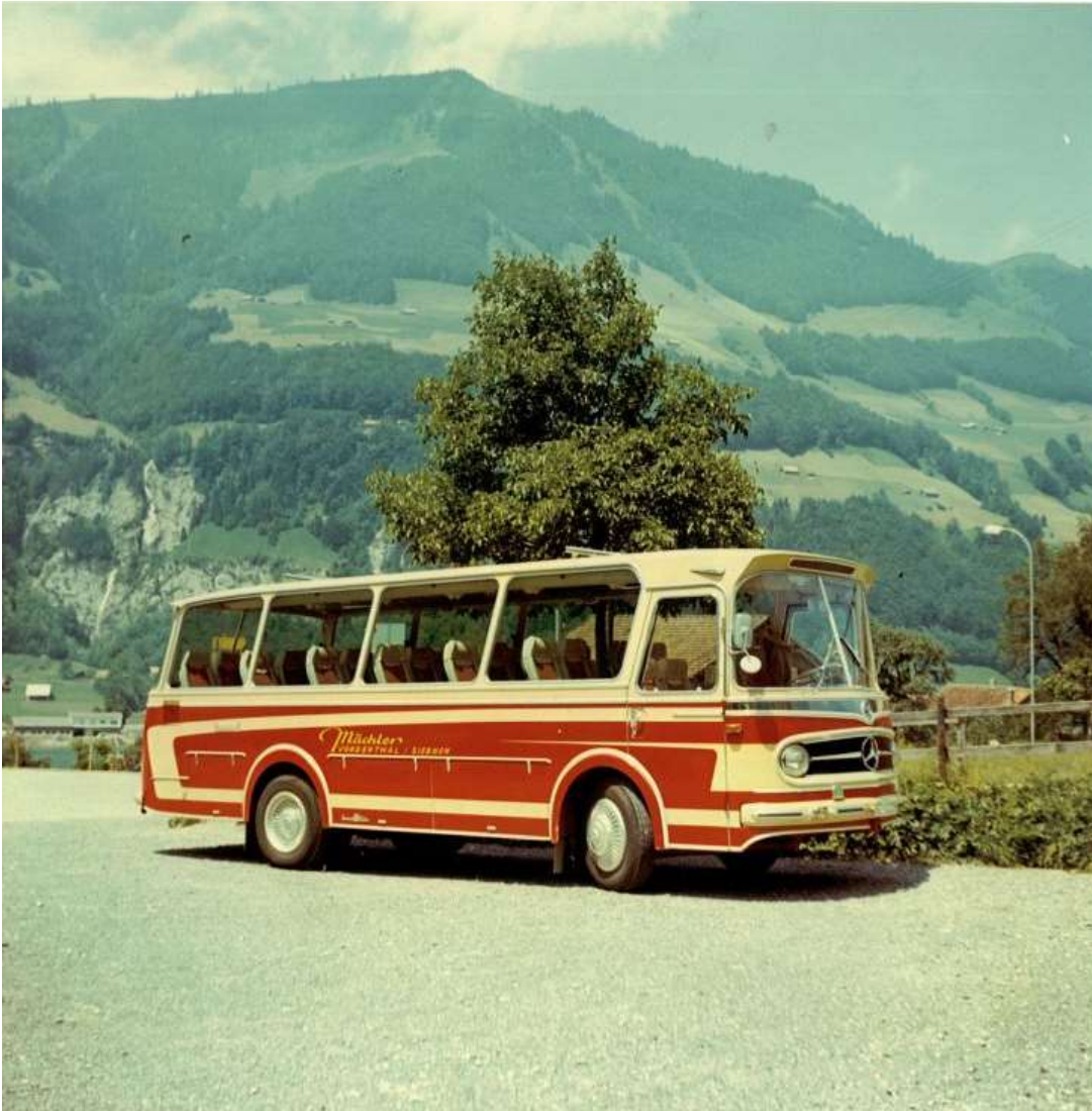
<<1964 Mercedes-Benz O321H mit Vetter-Aufbau, 27 Plätze >>

aus D-Fellbach bei Stuttgart. 1964 folgte ein weiterer O321H mit 27Plätzen und Vetter-Aufbau. Fortan etablierte sich die Marke Mercedes als Standard-Fahrzeug für den Ausflugsverkehr und den Personentransport der Firma Mächler.