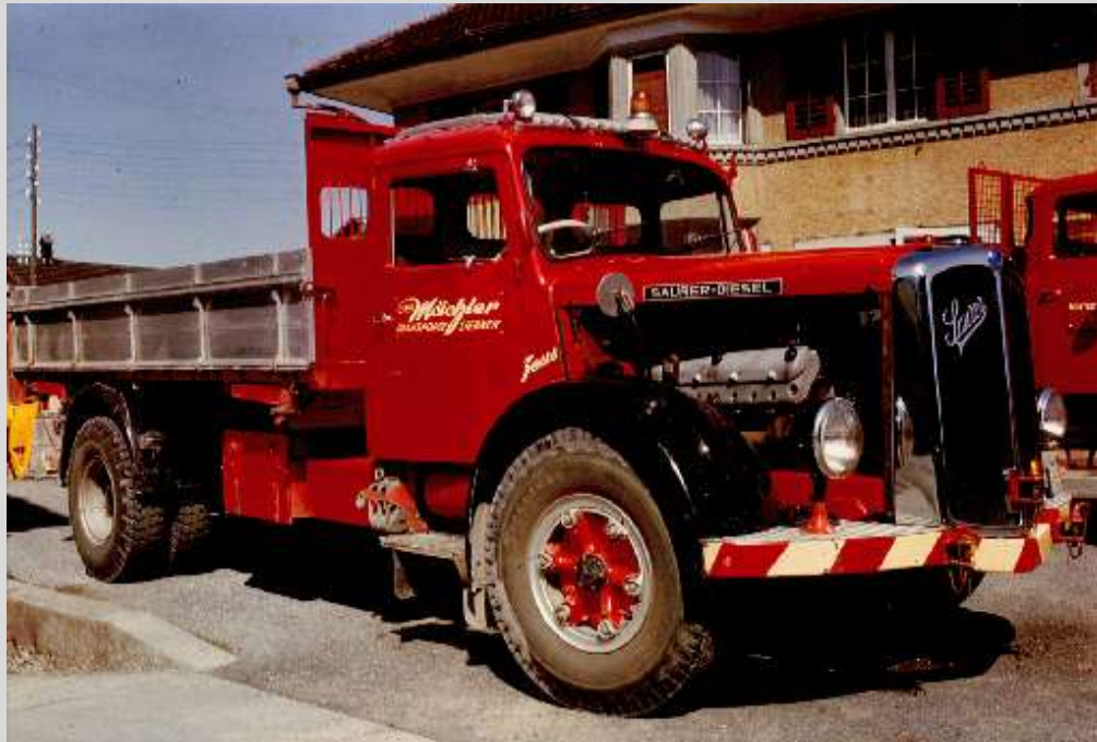
<<Saurer V8 'Zeus'>>