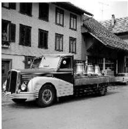
Saurer 4CT1D mit offener Überlandbrücke